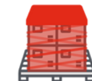
Fonction pose de coiffe palette